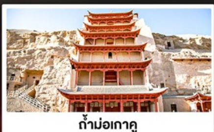
ถ้ำม่อเกาตุ