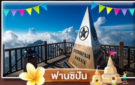
ฟานชิปัน