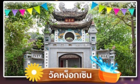
วัดห่งอกเซิน