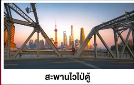
สะพานไวปี้ตู่