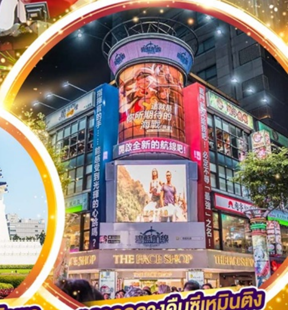
ตลาดกลางคืนซีเหมินติง