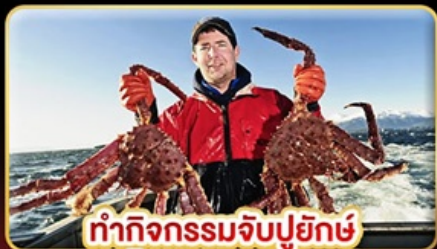
ทำกิจกรรมจับปูยักษ์ “พร้อมเมนูสุดพิเศษ”