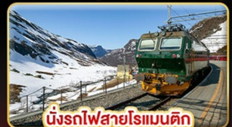
นั่งรถไฟสายโรแมนติก “พร้อมสปา”