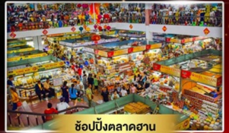
ช้อปปิ้งตลาดฮาน