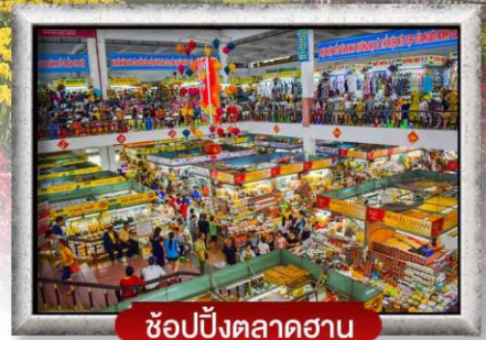
ซ้อปิ้งตลาดฮาน