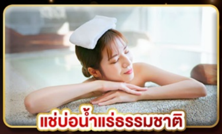
แช่น้ำแร่ธรรมชาติ