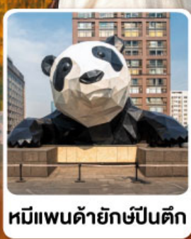
หมีแพนด้ายักษ์ป็นตึก