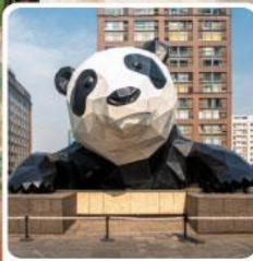
หมีแพนด้ายักษ์ปินตัก