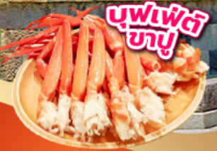
บุฟเฟ่ต์ ข้าว

เช็คอินจุดถ่ายรูป ศาลเจ้าฟูจิซัง อนุสาวรีย์โทเอ