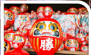
วัดแห่งชัยชนะ-วัดคัตสึโอจิ(วัดคารุมะ)