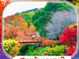
สวนบิวฮาตามิ