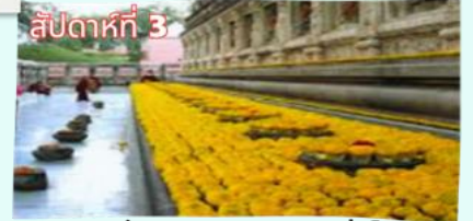
รัตนงอมเจดีย์