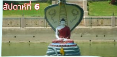
สระมัจฉิกร์ (จำลอง)