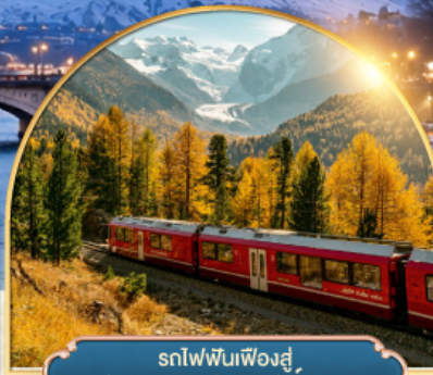
รถไฟฟันเฟืองสู่ยอดเขากรอนเนอส์แตรค