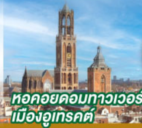
หอคอยคองทาวเวอร์ เมืองอูเทรคต์