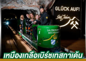
เหมืองเกลือเบิร์ชเทสกาเดิน