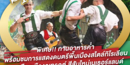
พิเศษ!! ทานอาหารค่ำ พร้อมชมการแสดงดนตรีพื้นเมืองสไตส์ทีโรเลียน และเยือนเมืองอูเทรคต์ สีสันใหม่เนเธอร์แลนด์

ไฮไลท์โปรแกรม • เยือนเมืองแห่งแคว้นบาวาเรีย และ ทิโรล • สุกสนานเหมืองเกลือเบิร์ชเทสกาเดิน • เข้าชมปราสาทนอยชวานสไตน์ • เดินเล่นจัตุรัสโรเมอร์ ซ็อบป์ิง Zeil Street • ถ่ายรูปมุมสวยของหมู่บ้านอัลสติก • ซิลลา ไปในเมืองซาลสบูร์ก บ้านเกิดโมสาร์ท 25 ก.ย. - 04 ต.ค. 69 • ล่องเรือหมู่บ้านทีธูร์น และ ล่องเรือชมนครอัมสเตอร์ดัม 09-18, 16-25 ต.ค. 69 • ซ็อบป์ิงจุ้ย่านดิมสแควร์และเดินเล่นย่านโคมแดง 22-31 ต.ค. 69 / 06-15 พ.ย. 69 29 ธ.ค. 69 - 07 ม.ค. 70 * ปีใหม่ *