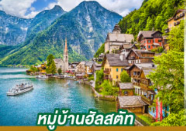
หมู่บ้านอัลสติก