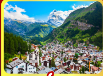
เชอร์รามาท