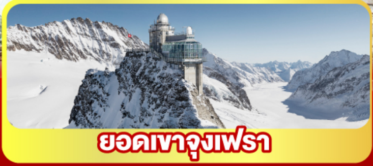
ยอดเทาจุงเฟรา