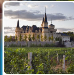
ไร่ไวน์ จุนยี่ เยียนโก