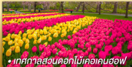
• เทศกาลสวนดอกไม้เคอเคนฮอฟ