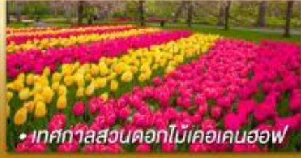
• เทศกาลสวนดอกไม้เคอเคนฮอฟ