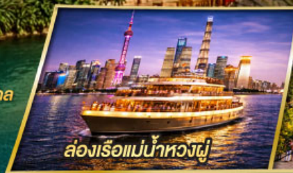
ล่องเรือแม่น้ำหวงหู

อาหารมือพิเศษ! เปิดปักกิ่ง, สุกี่มองโกล ★ Michelin Guide ★ ร้าน Tao Tao Ju