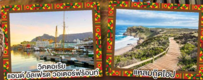
วิกตอเรีย แอนด์ อัลเฟรด วอเตอร์ฟรอนท์

เปิดประสบการณ์กับภัตตาคาร Canivore สวรรค์ของคนรักเนื้อสัตว์