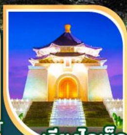
เจียงโกเชิก