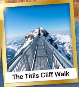
The Tittlis Cliff Walk