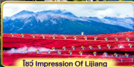
โชว์ Impression Of Lijiang