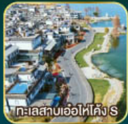
ทะเลสาบเอ๋อไห่โค้ง S