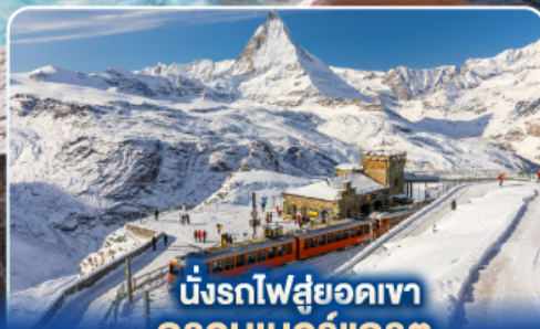
นั่งรถไฟสู่ยอดเขา กรอนเนอร์เกรต