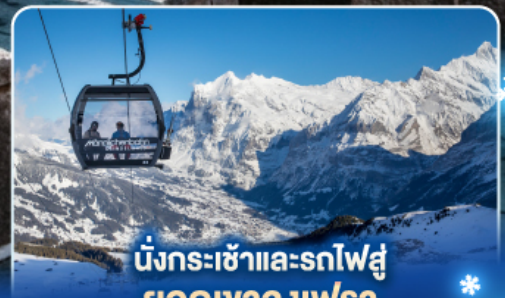
นั่งกระเช้าและรถไฟสู่ ยอดเขาจุงเฟรา