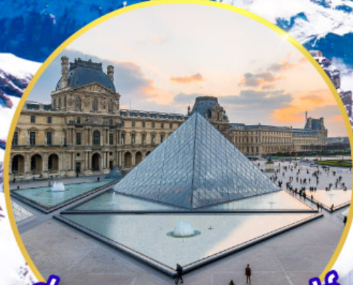
ถ่ายรูปคู่พีพีร์กันที่ลูฟท์