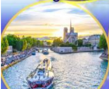
ล่องเรือแม่น้ำเซน