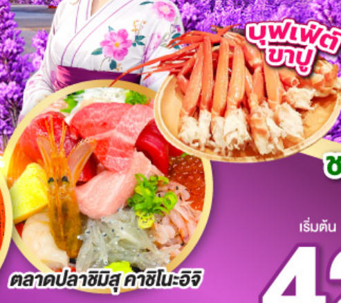
ตลาดปลาฮิมิสึ คาชิโนะอิจิ