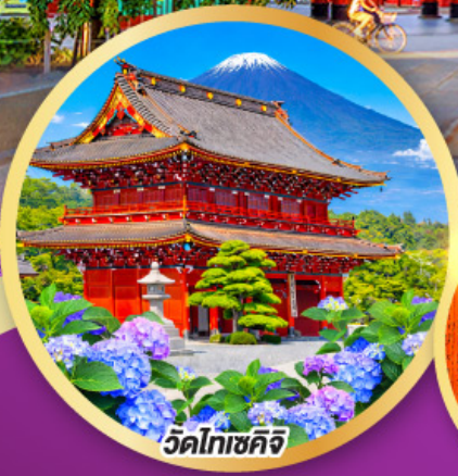
วัดโทเซคิจิ