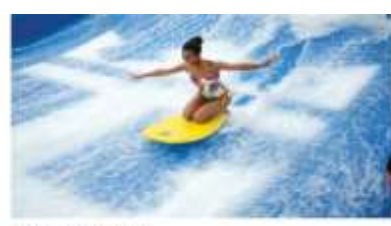
TAME THE TIDES