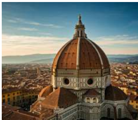
Duomo di Firenze

Piazza della Signoria: จตุรัสกลางเมืองที่รายล้อมไปด้วยอาคารสำคัญต่างๆ