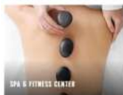
SPA & FITNESS CENTER