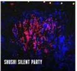
SHUSHI SILENT PARTY