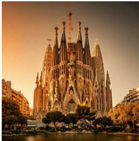
Sagrada Família barcelona spain

มหาวิหารซากราดาแฟมิลีย (Sagrada Família): สัญลักษณ์ของบาร์เซโลนาและผลงานชิ้นเอกของเกาดิที่ยังสร้างไม่เสร็จ แต่ก็สวยงามตระการตาด้วยสถาปัตยกรรมที่แปลกตาและรายละเอียดที่ประณีต