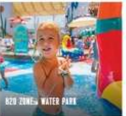
B20-ZONE WATER PARK