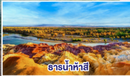
ธารน้ำห้าสี