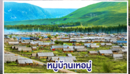
หมู่บ้านทอมู่