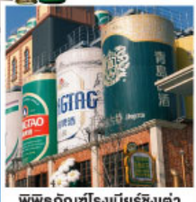
พิพิธภัณฑ์โรงเบียร์ชิงเต่า