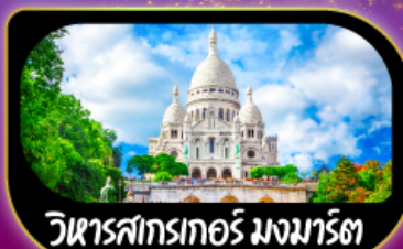
วิหารสากเรทอร์ มงมาร์ต