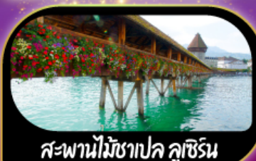
สะพานไม้ชาเปล คูซีน