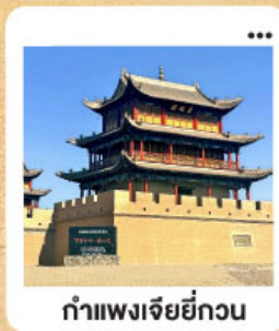
กำแพงเจียยี่กวน