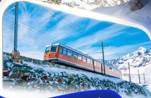
ขึ้นรถไฟฟันที่ฟ็องกอนนอร์เกรต