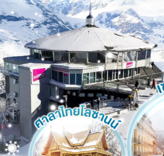
ศาลาไทยโลซานน์