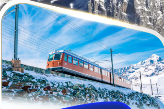
ขึ้นรถไฟฟันที่ฟ็องทอนนอร์เกรต