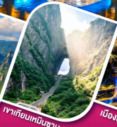
เจาเทียนเหมินชัน