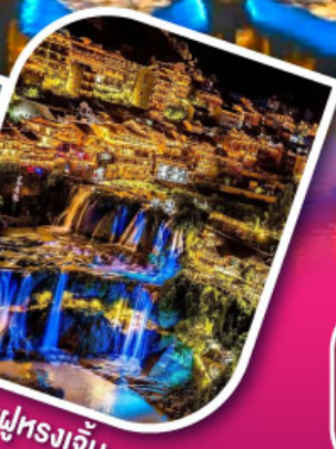
เมืองฝูหลงเจิ้น