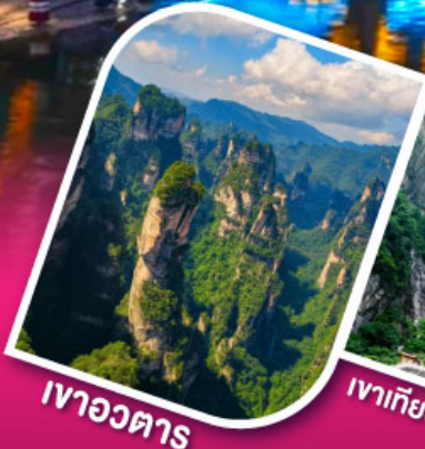
เจาอวตาร