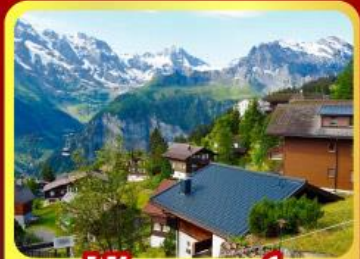
หมู่บ้านเมอร์เสน