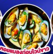
หอยแมลงภู่อบไวน์ขาว