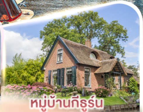
หมู่บ้านทิรุร์น