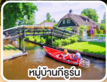
หมู่บ้านทึร์น