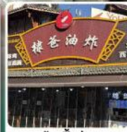
ร้านปิ้งย่างของพ่อหวังหอดี้