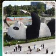
รูปปั้นหมีแพนด้าเซลฟี่

แวะชิมปิ้งย่างหม่าล่า ร้านคุณพ่อ (แว้งแอดตี้) ที่เมืองเล่อซาน