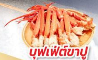
บุฟเฟ่ต์ซาซิมิ