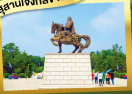
เนินทรายสีงชาวน