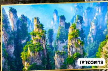
เวาอวตาร