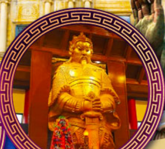
วัดชวงกหวง