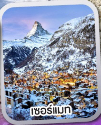
เซอร์แมท