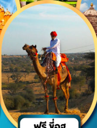
ฟรี ขี่อูฐ เมืองมันทว่า