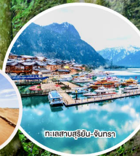
ทะเลสาบสุริยอัน-จินกรา