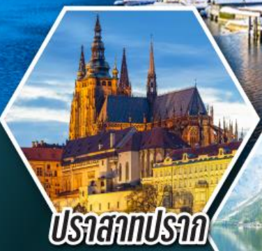
ปราสาทปราก