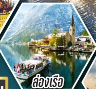
ล่องเรือ ทะเลสาบอัลสติก