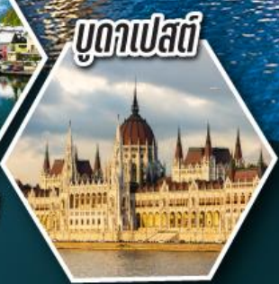
บูดาเปสต์