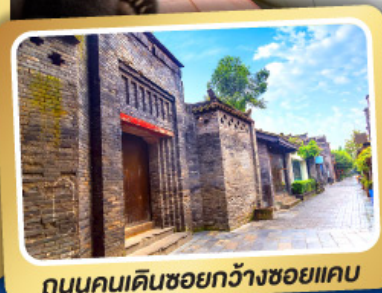
ถนนคนเดินชอยกว้างชวยแคบ