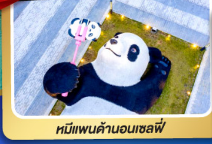
หมีแพนด้าอนเซลฟ์