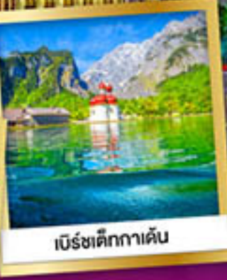
เบียร์ชเติกกาเดิน