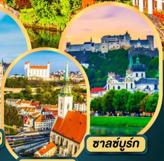
ซาลซ์บูร์ก