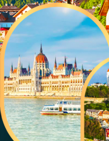
ล่องเรือแม่น้ำดานูบ