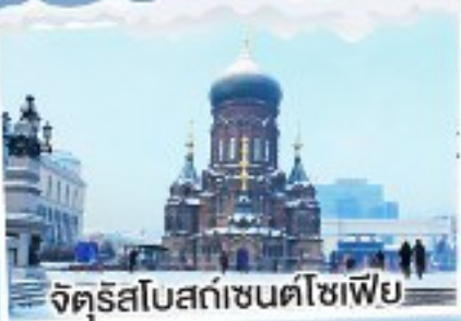
จัตุรัสโบสถ์เซนต์โซเฟีย