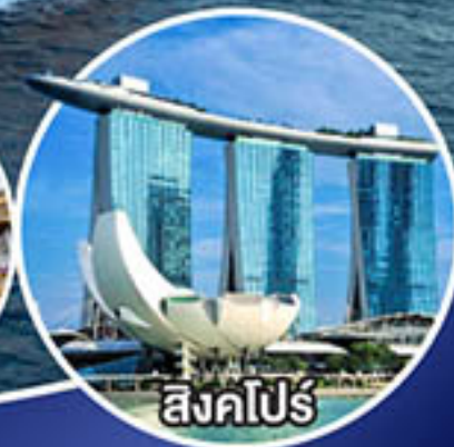
สิงคโปร์